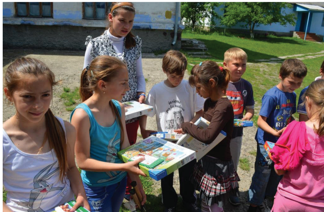
Elevii clasei a IV-a din s. Saharna Nouă, Rezina, bucușori de jocurile puzzle și ciocolatele elvețiene.

În satul Glingeni (Fălești) lumea s-a organizat în transportarea coletelor după trasee doar de localnici știute, cu căruțe, ajutându-se unul pe celălalt, semn că mărinimia persistă și în aceste suflete de neam.