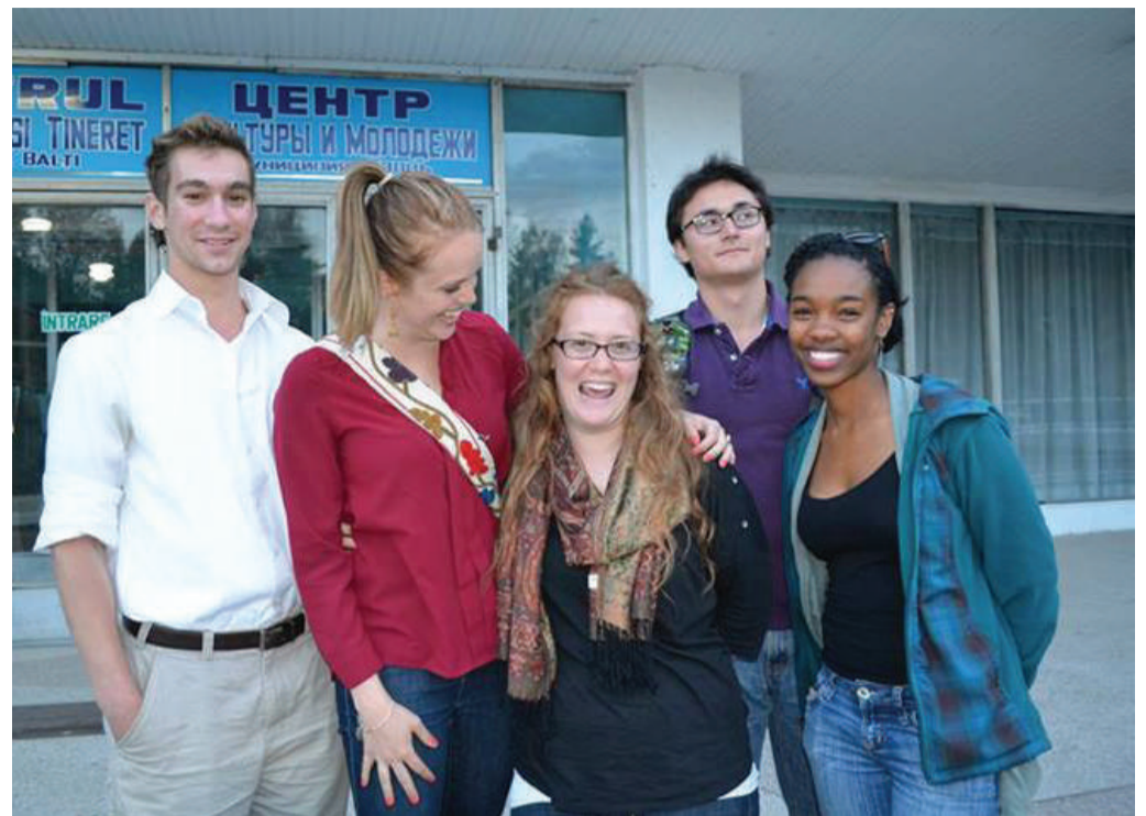
Voluntarii de la Corpul Păcii