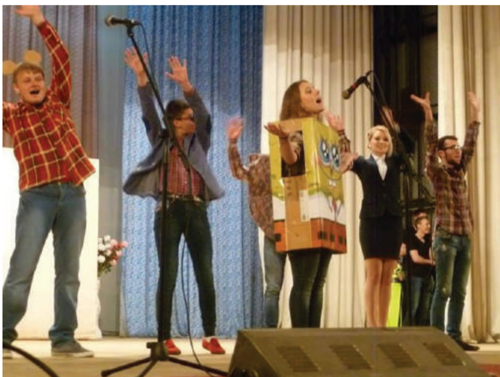
Echipa „Opinie separată”

AO „Casmed” dorește să mulțumească tuturor persoanelor, firmelor și participanților care au făcut ca acest concert de caritate să fie un mic, dar de un real și important succes.